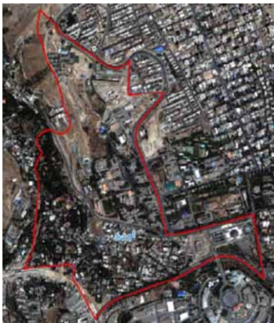
تصویر شماره ۱: عکس هوایی محله اوین

نکته حایز اهمیت این‌که مطالعات موجود در این زمینه بیش‌تر صرفاً به احساس امنیت یا در مواردی به مباحثی هم‌چون نقش کاربری یا کالبد در احساس امنیت پرداخته و کم‌تر نقش و تأثیر منظر در این مقوله را بررسی کرده‌اند. با توجه به طرح مسأله و ضرورت‌های تحقیق، هدف اصلی «سنجش احساس امنیت شهروندان با استفاده از مؤلفه‌های منظر شهری» و شناسایی روابط میان منظر شهری و احساس امنیت است. براساس اهداف تعیین شده، پرسش اصلی تحقیق چنین است: وضعیت احساس امنیت شهروندان در محدوده مورد مطالعه در چه سطحی است؟ و کدام یک از مؤلفه‌های منظر شهری بر احساس امنیت شهروندان مؤثر است؟