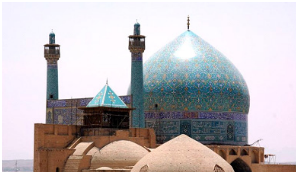
تصویر شماره ۱: گنبد مسجد امام اصفهان

در این مقاله بر پایه تفکیک گزاره‌های حقیقی و اعتباری و مسائل بالقوه وجودی (قطعی) و بالفعل انسانی (نسبی)، به تبیین برخی دیگر از مسائل منبعت از چگونگی این تفکیک نظیر رابطه صورت (کالبد آثار معماری) و محتوا (بطن فرهنگی) از منظر اسلامی می‌پردازیم.