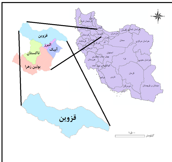
شکل شماره ۱: موقعیت جغرافیایی قزوین در استان و کشور ایران