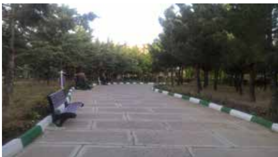
تصویر شماره ۱۳: نداشتن سیستم نورپردازی در بوستان میرداماد؛ ماخذ: نگارندگان

می‌کند، زیرا افزایش حضور مردم افزایش امنیت و تعاملات مثبت را در پی دارد و افزایش تعاملات به شکل‌گیری گروه‌ها با ویژگی‌های مشترک و مطلوب منجر می‌شود. از آن‌جا که رفتارهای ضد شهروندی با فضاهای شهری قابل‌کنترل است، احساس امنیت در مقابل جرایم عدم ازدحام جمعیت، احترام به حقوق شهروندی، عدم احساس تفاوت‌های اجتماعی، حضور شبانه مردم، ملاقات روزانه مردم، عدم آلودگی صوتی و روابط اجتماعی مناسب، از عوامل مهم در رضایت از مکان است (Phillis et al, 2004: 46-70). نداشتن نورپردازی در مسیرهای داخلی بوستان میرداماد (تصویر شماره ۱۳)، و وجود صدای ماشین‌های اتوبان کسایی در بوستان بهاران (تصویر شماره ۱۴)، از موارد نارضایتی کاربران این دو بوستان است.