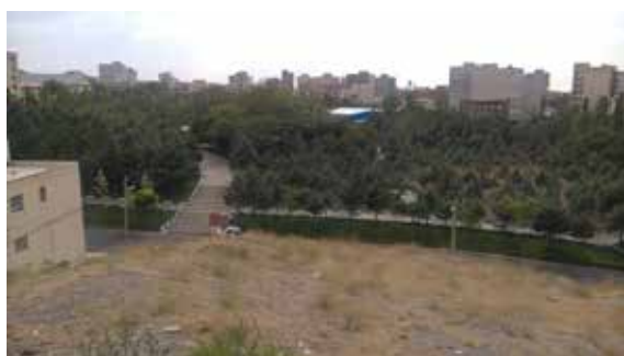
تصویر شماره ۱۲: فضاهای رها شده در بوستان میرداماد

پرهیز از ایجاد فضاهای وسیع، خلق فضاهایی با عملکردهای مجزا و تعریف شده با هدف ارتقای حضور گروه‌های سنی و جنسی مختلف می‌تواند به خلق محیط امن کمک شایانی کند (نیومن، ۱۳۸۷: ۸۲-۸۳). تعریف فضاها به تعریف قرارگاه‌های رفتاری و الگوهای رفتاری مورد انتظار منجر می‌شود. این امر در سامان‌دهی کالبدی و رفتاری محیط بسیار مهم است. سامان‌دهی و ایجاد شرایط حضور و رفت و آمد در کنج‌ها و فضاهای رهاشده باعث فعالیت و سرزندگی این فضاها می‌شود. در نتیجه احساس ناامنی در چنین فضاهایی از بین می‌رود (همان، ۲۸-۴۴). بسیاری از مصاحبه‌شوندگان از وجود فضاهای رها شده و ترس برانگیز در بوستان میرداماد احساس نارضایتی داشتند (تصویر شماره ۱۲).