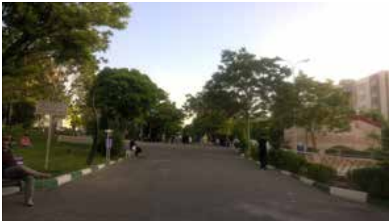
تصویر شماره ۱۷: نظارت محسوس و نامحسوس در بوستان زغفرانیه

آن‌ها وجود ندارد مستعد بروز خطرات جانی و مالی هستند. نیومن پیشنهاد می‌کند که فضاهای شهری باید دوباره به طریقی ساخته شوند که قابل زندگی باشند و به جای پلیس توسط مردمی که در آن زندگی می‌کنند کنترل شوند (نیومن، ۱۹۷۳). تقریباً تمام حاضران در بوستان بهاران از کنترل نامحسوس خانواده‌ها بر حضور همدیگر احساس رضایت داشتند. در میان بوستان‌های مورد نظر پاسخگویان بوستان میرداماد کم‌ترین میزان رضایت را از این مؤلفه داشتند (تصویر شماره ۱۷).