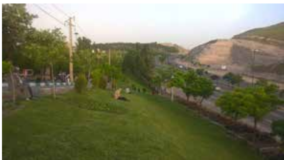
تصویر شماره ۱۴: نزدیکی به اتوبان در بوستان بهاران