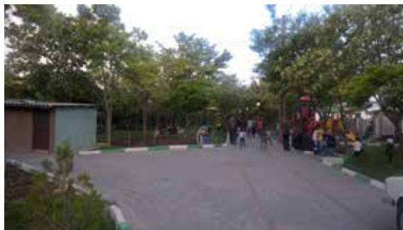
تصویر شماره ۱۱: قابل‌رؤیت بودن فضاهای پارک در پارک بهاران

«فضای کوچک‌تر امنیت و صمیمیت بیش‌تر و نیز میل به تعامل اجتماعی قوی‌تری را خواهد داشت و در فضاهای وسیع، احساس بدون حفاظ بودن و در نتیجه ناامنی وجود دارد» (هال، ۱۳۷۹: ۵۴). قابل‌رؤیت بودن فضا یکی از ملاک‌هایی است که قابل‌کنترل بودن و امنیت فضا اشاره دارد. این موضوع یکی از ویژگی‌های مورد توجه در بوستان بهاران است (تصویر شماره ۱۱).