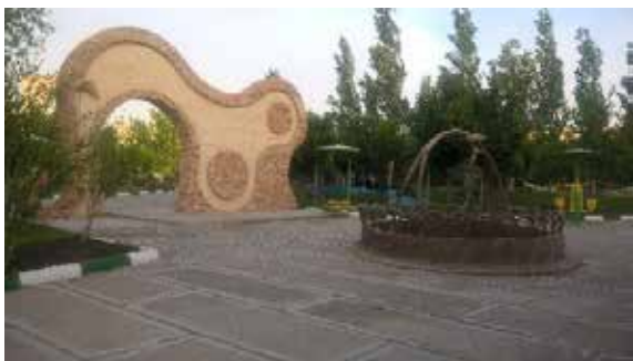
تصویر شماره ۱۹: فضاهای مکث و نقاط تأکید در بوستان بهاران؛ مأخذ: نگارندگان

ارائه می دهند غالباً بستر مناسبی برای فعالیت های اختیاری هستند. تأکید بر پیاده روی و توجه به مناظر و نقاط تأکید در مردم گرا کردن فضای شهری نقش مهمی دارند. توجه به گیاهان در لایه ها و سطوح متنوع سبب می شود افراد در سنین متفاوت با وجود خط دیدهای مختلف، دیدهای مطلوبی از فضا داشته باشند. وجود متریا ل های طبیعی، طرح های زیبا و ... که مناسب با ذائقه و فرهنگ مردم است، حس خوبی را منتقل کند و در اجتماع پذیری فضا مؤثرند (تصویر شماره ۱۹).