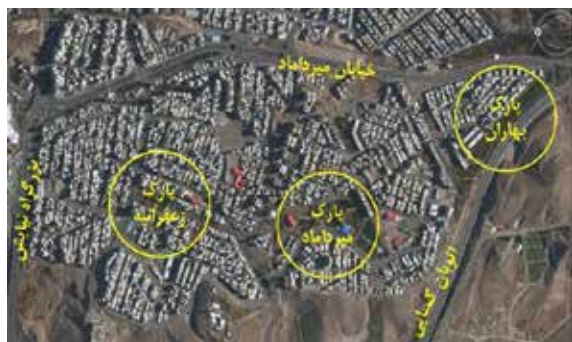
تصویر شماره ۱: موقعیت سه بوستان محله‌ای بهاران، میرداماد و زعفرانیه در شهرک زعفرانیه تبریز؛ مأخذ: سایت GoogleMap، ترسیم: نگارندگان

دومین بوستان از نظر قدمت، بوستان میرداماد است. شهرسازی سرپوشیده سرزمین عجایب میرداماد یکی از قدیمی ترین شهرسازی های سرپوشیده تبریز است که در جنب بوستان میرداماد واقع شده است. بوستان بهاران یکی از بوستان های جدید تبریز قلمداد می شود. این بوستان وسعتی معادل ۷ هکتار دارد و از امکانات در نظر گرفته شده برای فاز دوم این بوستان می توان به زمین اسکیت، وسایل ورزشی، پارکینگ، آلاچیق و دستگاه های بازی کودکان اشاره کرد.