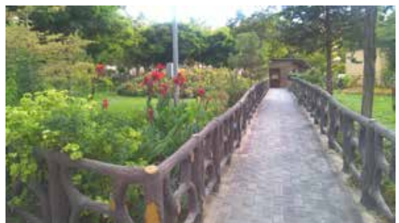
تصویر شماره ۱۶: فضای واضح و بدون ابهام در بوستان بهاران؛ مأخذ: نگارندگان

خوانایی و شفافیت و بدون ابهام بودن فضا به حس قربت و نزدیکی استفاده‌کنندگان از فضاهای عمومی منجر می‌شود. تحقیقات لنگ نشان داد محیطی که کلیتی مبهم ارائه می‌دهد ترس گم شدن و بدبینی در محیط را افزایش می‌دهد (لنگ، ۱۳۸۱). لینچ معتقد است محیط باید به گونه‌ای باشد که با کم‌ترین اطلاعات بتوان کلیتی را دید و فقدان آن کلیت باعث استنباط نامطلوب و سرگردانی در محیط می‌شود (لینچ، ۱۳۸۱). توانایی درک و فهم مکان به ایجاد حس مکان کمک می‌کند. حس مکان موجب احساس تعلق به مکان می‌شود و این گونه محیط، رابطه ادراکی-عاطفی با انسان برقرار می‌نماید. در بوستان بهاران وجود فضاهای واضح و خالی از ابهام از عوامل رضایت مصاحبه‌شوندگان است (تصویر شماره ۱۶).