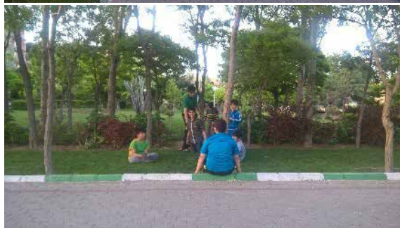
تصویر شماره ۱۸: پاسخگویی به نیاز گروه های مختلف سنی در بوستان میرداماد؛ مأخذ: نگارندگان