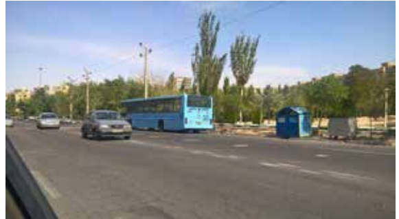
تصویر شماره ۱۵: عدم رضایت کاربران از مشخص نبودن محدوده بوستان میرداماد؛ مأخذ: نگارندگان

شده غریبه‌ها و تماس مستقیم آن‌ها با ساکنان موجب ایمنی فضاهای شهری است (مدنی پور، ۱۳۷۹، ۱۱۹-۱۲۴). تقریباً تمام خانواده‌های مصاحبه‌شونده در بوستان میرداماد به دلیل امکان حضور افراد متفاوت و عابران متفرقه در بوستان، احساس امنیت کم‌تری نسبت به دو بوستان دیگر داشتند (تصویر شماره ۱۵).