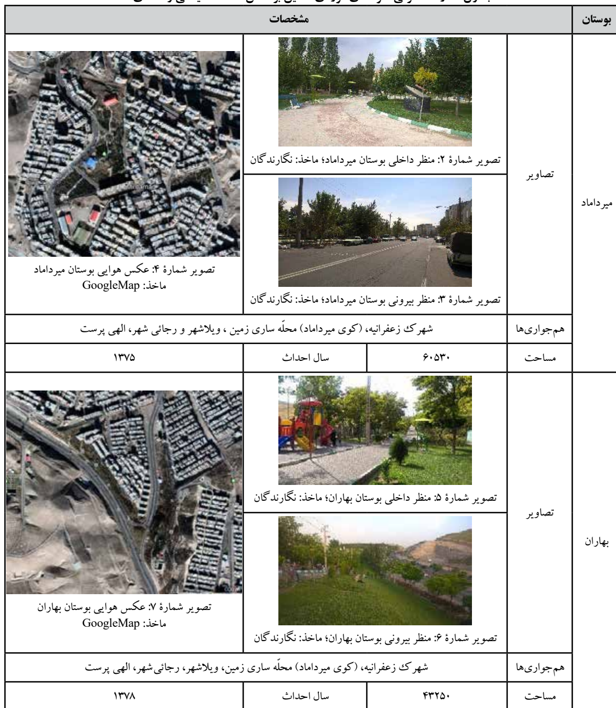
جدول شماره ۲: معرفی نمونه های موردی تحقیق بر اساس مطالعات میدانی و اسنادی

دومین بوستان از نظر قدمت، بوستان میرداماد است. شهرسازی سرپوشیده سرزمین عجایب میرداماد یکی از قدیمی ترین شهرسازی های سرپوشیده تبریز است که در جنب بوستان میرداماد واقع شده است. بوستان بهاران یکی از بوستان های جدید تبریز قلمداد می شود. این بوستان وسعتی معادل ۷ هکتار دارد و از امکانات در نظر گرفته شده برای فاز دوم این بوستان می توان به زمین اسکیت، وسایل ورزشی، پارکینگ، آلاچیق و دستگاه های بازی کودکان اشاره کرد.