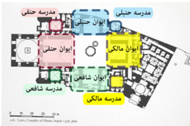
تصویر شماره ۴: مسجد و مدرسه سلطان حسن، ایوان و مدرسه چهار فرقه در چهار ضلع مسجد مأخذ: بورکهارت، ۱۳۹۲، ۱۴۶

و چپ قبله به ترتیب مربوط به مذهب حنبلی و شافعی است. قسمت بندی چهار مذهب به چهار سالن که به صورت چلیپا قرار گرفته‌اند، یک قسمت بندی کلاسیک است که به مدل‌های معروفی مانند مدرسه نظامیه در نیشابور و مدرسه مستنصریه بغداد بر می‌گردد (بورکهارت، ۱۳۹۲: ۱۵۳).