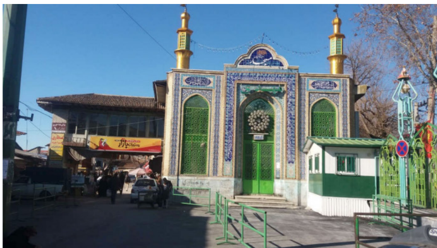
تصویر شماره ۲: مسجد حاج آقا کوچک؛ ماخذ: نگارندگان

(نظیف، ۲۰۱۳۹۰). هر محله یک تکیه داشت که ایام عزاداری و اعیاد محل برگزاری مراسم عمومی بود. تعدادی از این تکیه‌ها اکنون به علت فرسودگی کاربرد خود را از دست داده است. تکیه وصاف‌خانه در ضلع شمالی و تکیه‌های دیگر در طبقه دوم ضلع‌های جنوبی و غربی میدان گاه عباسعلی و برگزاری مراسم مذهبی در این مکان‌ها جلوه خاصی خصوصاً در ایام ماه محرم به فضای میدان می‌دهد.