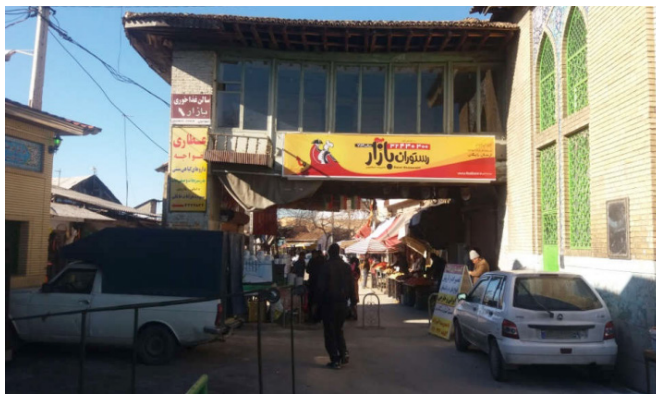
تصویر شماره ۵: ورودی بازار