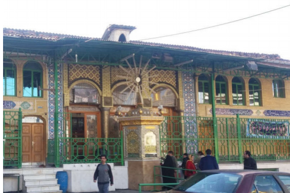
تصویر شماره ۳: سقاخانه حضرت ابوالفضل (ع)

سقاخانه حضرت ابوالفضل هم‌چون سایر سقاخانه‌های ایران در محل‌های پرتردد بویژه در نزدیکی بازار کهنه واقع شده است. این سقاخانه در ضلع غربی میدان گاه، مامن و ماوای درماندگان و محلی برای طلب حاجات انسان‌ها واقع شده است. در ایران باستان الهه زن (آناهیتا) الهه آب بود، در دین اسلام نیز حضرت فاطمه مظهر آب و پاکی به حساب می‌آمد و گاهی آب را کابین حضرت زهرا (س) می‌دانستند (معطوفی، ۱۳۹۴: ۳۶۴). مردم وقتی از حل مشکلات دنیوی خود ناامید می‌گردند، روح و جسم را به ساحت باری تعالی صیقلی داده و با نوشیدن جرعه‌ای از این آب با واسطه قرار دادن حضرت ابوالفضل (ع) حاجت خود را از معبود خویش طلب می‌نمایند.