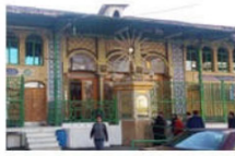
سقاخانه حضرت ابوالفضل (ع)