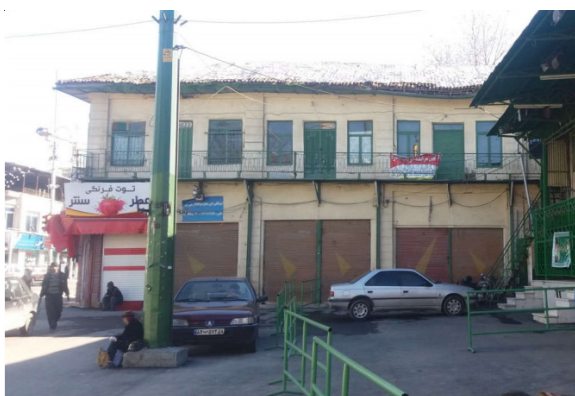
تصویر شماره ۴: تکیه عباسعلی

(نظیف، ۲۰۱۳۹۰). هر محله یک تکیه داشت که ایام عزاداری و اعیاد محل برگزاری مراسم عمومی بود. تعدادی از این تکیه‌ها اکنون به علت فرسودگی کاربرد خود را از دست داده است. تکیه وصاف‌خانه در ضلع شمالی و تکیه‌های دیگر در طبقه دوم ضلع‌های جنوبی و غربی میدان گاه عباسعلی و برگزاری مراسم مذهبی در این مکان‌ها جلوه خاصی خصوصاً در ایام ماه محرم به فضای میدان می‌دهد.