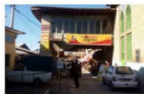
ورودی بازار جنب میدان