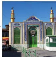
مسجد حاج آقا کوچک