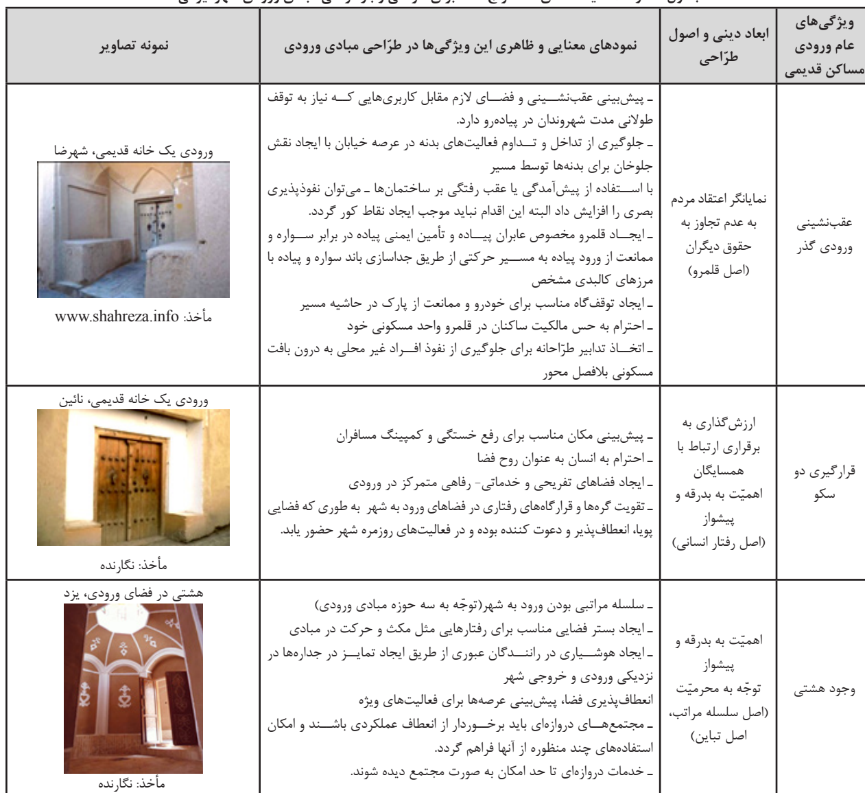
جدول شماره ۱۰: سیاست های استخراج شده برای طراحی و بازطراحی مبادی ورودی شهر ایرانی

که به هم پیوند می یابند، منطبق سازد. ورودی شهرها در گذشته فضای آماده شدن برای آزمودن تجربه جدید بود. فضایی برای پیوند میان آن چه که گذشت و آن چه که در پیش روست. فضایی که شخص در آن می آزمود تا برای آزمودن تجربه های جدید آماده شود. در این پژوهش با بررسی ویژگی های ۲۰ نمونه ورودی مسکن قدیمی در دوره ها و سبک های مختلف (جدول شماره ۲ تا ۴)، سیاست های مرتبط برای طراحی و بازطراحی مبادی ورودی شهر ایرانی استخراج شد تا ورودی شهرها، نه فقط یک فضا که مکانی پذیرای فعل ورود با تمام آداب و ویژگی هایش باشد. در نتیجه، تمام این سیاست ها در جهت طراحی و بازطراحی فضای ورودی با تأکید بر جنبه های کالبدی- فضایی، ارتباطی و عملکردی در جهت معکوس نمودن فرایند افت شهری و رونق چند بعدی این بخش از شهر می تواند مورد استفاده قرار گیرد. این سیاست ها در جدول شماره ۱۰ جمع بندی شده اند.