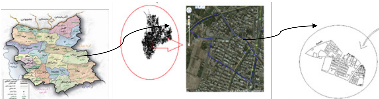
تصویر شماره ۱: پلان شهر و محدوده سایت، مأخذ: www.earth.google.com

شهرستان بناب با وسعت ۷۷۹ کیلومتر مربع در جنوب غربی استان آذربایجان شرقی و در جلگه‌ای صاف و هموار قرار دارد. براساس نتایج سرشماری عمومی نفوس و مسکن در سال ۱۳۹۰، جمعیت شهرستان بناب در حدود ۱۲۹۷۹۵ نفر و جمعیت مرکز این شهرستان ۷۹۸۹۴ نفر و تعداد ۳۷۳۸۰ خانوار است. محله فرهنگیان واقع در شمال غربی بناب با جمعیتی بالغ بر ۲۱۶۰ نفر، از لحاظ حوزه نفوذ و خدمات‌رسانی به منطقه نقش محله‌ای و فرامحله‌ای قرار دارد. محله کوی فرهنگیان در حدود سال ۱۳۶۰ در جهت اجرای سیاست زمین شهری دولت جمهوری اسلامی در اختیار قشر فرهنگی و کارمند شهرستان بناب قرار گرفت. ابتدا قسمت میانی و واحد همسایگی هسته مرکزی شکل گرفت و پس از آن از سال ۱۳۷۵ کوی میلاد با حضور قشر بالای جامعه توسعه یافت ( http://www.ostan-as.gov.ir )