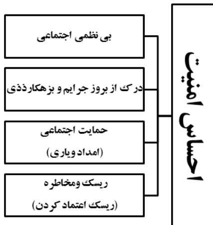
نمودار شماره ۱: الگوی تحلیلی عوامل تأثیرگذار بر احساس امنیت

در الگوی تحلیلی حاضر بر رابطه یک سوبه میان متغیرها تأکید شده است. با وجود این، رویکردهای نظری مورد بررسی، غالباً به رابطه دوسویه و متقابل متغیرها توجه می‌کنند. چنان که برخی نظریه‌ها بر این نکته تأکید می‌کنند که بی‌نظمی اجتماعی می‌تواند ریسک و مخاطره (ریسک اعتماد کردن) را ایجاد کند و ریسک و مخاطره نیز سبب احساس ناامنی و ترس می‌شود. هم‌چنین احساس ناامنی و ترس نیز به نوبه خود می‌تواند موجب کناره‌گیری افراد از فعالیت‌های اجتماعی، به خصوص زنان و محدودشدن ارتباطات آن‌ها و تضعیف کنترل اجتماعی غیررسمی شود و زمینه مناسبی را برای بی‌نظمی اجتماعی فراهم سازد. در واقع چرخه‌ای معیوب میان بی‌نظمی اجتماعی، ریسک و مخاطره و احساس ناامنی و ترس وجود دارد که می‌تواند یکدیگر را تولید و بازتولید نمایند.