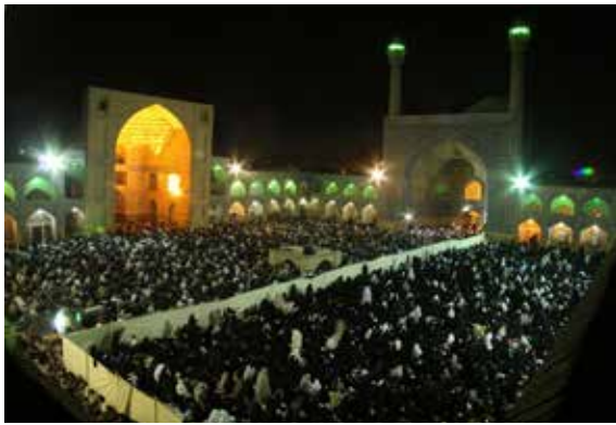
تصویر شماره ۱۱: صحن مسجد جامع در شب قدر زمان ساخت مسجد حیاط دار تا سال ۱۳۱۰ شمسی و از ۱۳۱۰ تا ۱۳۹۲ (شمسی) بررسی و تغییرات آن مشخص شد: