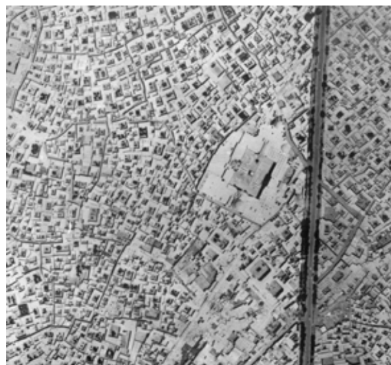
تصویر شماره ۷: عکس هوایی سال ۱۳۳۵؛ مأخذ: فقیه، ۱۳۵۴

مسیرها و گذرهای شهری قرار نگرفته است، بلکه خود جزئی از شبکه معابر و «همانند یک گره، پیوند دهنده مسیرها و گذرهای شهر شده است» (تولایی، ۱۳۸۷: ۴۵). شبستان‌ها را می‌توان گذرگاه‌هایی دانست که به صورت واسطه بین بیرون و درون قرار گرفته‌اند. مسجد در پلان لکه جوهری است چکیده در متن شهر. بدین شکل به نظر می‌رسد ساختمانی که با عظمت غول‌آسایی از زمین روییده، در شهر گرداگردش ذوب شده است و به همین خاطر نمی‌توان لبه‌های آن را از بافت شهری که دائماً جا به جا می‌شود جدا و مشخص کرد (گرابار، ۱۳۸۸: ۱۵ و ۳۱). از آنجا که سهولت دسترسی از الزامات اصلی مساجد است ۱۷ ، در طول زمان، ورودی‌های بنا در انطباق و امتداد گذرهای شهری شکل گرفته‌اند و این گونه یک عنصر معماری در امتزاج با تاریخ شهر به صورت یک جریان مداوم شکل گرفته است (توسلی، ۱۳۸۱: ۱۷).