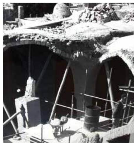
تصویر شماره ۴ و ۵: بازسازی پس از بمباران