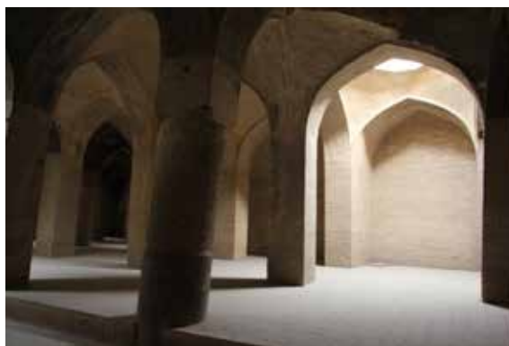
تصویر شماره ۶: قسمت‌های بازسازی شده با ستون‌های مستطیلی