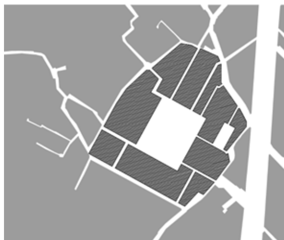
تصویر شماره ۸: ارتباط بنا و شبکه معابر بر اساس عکس هوایی سال ۱۳۳۵

این شکل ارتباط مساجد با گذرهای عمومی بهترین صورت بیان کالبدی مفهوم مسجد به عنوان خانه خدا، خانه‌ای متعلق به همه بوده است (توسلی، ۱۳۷۱: ۴۶). در سال‌های اخیر، به منظور