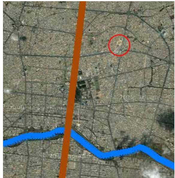
تصویر شماره ۴: موقعیت مسجد جامع عتیق نسبت به محور هندسی چهار باغ و محور ارگانیک زاینده رود.