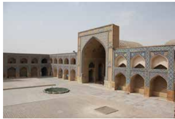
تصویر شماره ۱۰: صحن مسجد جامع در بعد از ظهر یک روز زمستانی به منظور بررسی تغییرات نقش مسجد جامع در نظام و ساختار شهری، با توجه به تغییرات نظام شهرسازی در دوره معاصر، مؤلفه‌های سازنده کیفیات فضای شهری در دو دوره زمانی (از