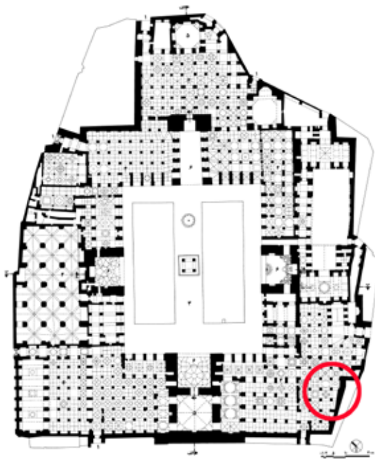
تصویر شماره ۳: محل اصابت راکت

در دوره تیموری، شبستانی در جنوب غربی مسجد (گالدیری، ۱۳۷۰: ۶۶) و تزیین‌ها و کاشیکاری‌های رو به صحن اضافه گردید (گذار، گذار، و سیرو، ۱۳۷۱ الف: ۲۸۷). پس از آن در دوره صفوی شبستان زمستانی (بیت الشتا) در غرب مسجد (گالدیری، ۱۳۷۰: ۶۰) و همچنین شبستان صفوی در جنوب غربی مسجد و با تغییر در قسمتی از شبستان تیموری ساخته شد و کاشیکاری‌های نفیسی به مسجد اضافه شد (هنرفر، ۱۳۵۰: ۷۱). در دوره قاجار سردر ورودی فعلی مسجد ساخته شد (جبل عاملی، ۱۳۸۷: ۱۴). علاوه بر آن تغییرات جزئی و بیش‌تر در تزیین‌ها انجام شد. همچنین مرمت و توسعه مقبره علامه مجلسی در این دوره انجام شد (گذار، گذار، و سیرو، ۱۳۷۱ ب: ۸۵). در دوره معاصر مهم‌ترین تغییرات کالبدی مربوط به تخریب قسمتی از مسجد در جریان جنگ تحمیلی است. با وجود اینکه مسجد جامع جزء آثار تاریخی ثبت شده بود و بنا بر معاهده لاهه (۱۹۴۵) تخریب آثار تاریخی در حین جنگ ممنوع است، در جریان جنگ تحمیلی ایران و عراق بمباران و بازده چشمه از شبستان جنوبی تخریب شد. پس از آن سازمان میراث فرهنگی آن را به شکل اول با ستون‌های مستطیل و با آجرهای جدید بازسازی کرد. همچنین محل اصابت راکت با چیدمان متفاوت کف فرش، مشخص شده است. (جبل عاملی، ۱۳۸۷: ۱۲؛ رضا زاده، ۱۳۹۰: ۲۷۹).